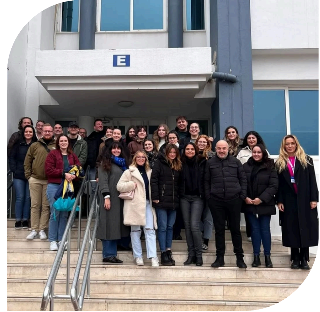
Hochschule für öffentliche Verwaltung Kehl Üniversitesi kampüsümüzü ziyaret etti.