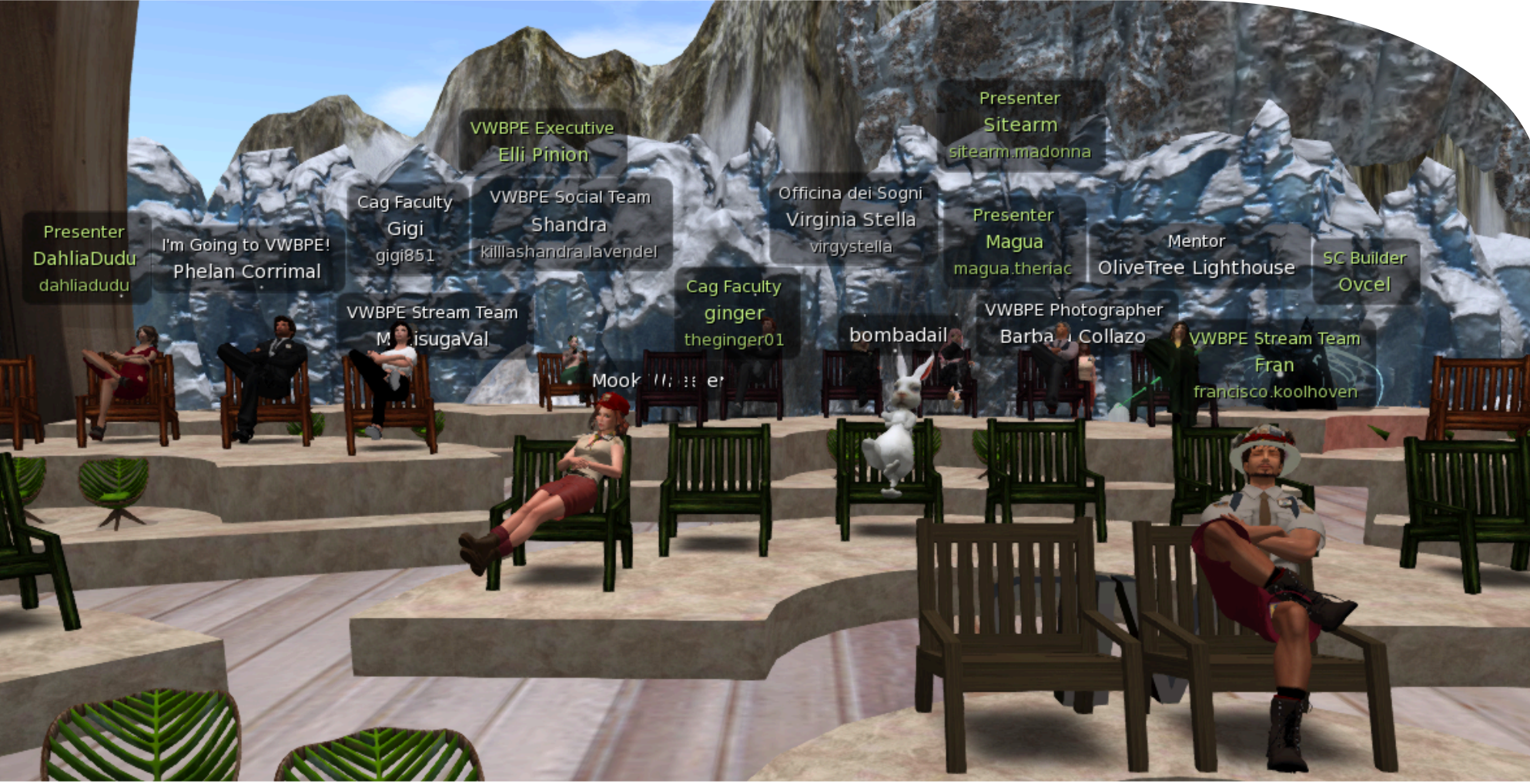
Çağ Üniversitesi ve VVEC tarafından düzenlenen ve sanal dünyalarda gerçekleştirilen sempozyum başarıyla tamamlandı.