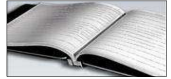
Şekil 1: Türkiye Afet Müdahale Planı (TAMP)