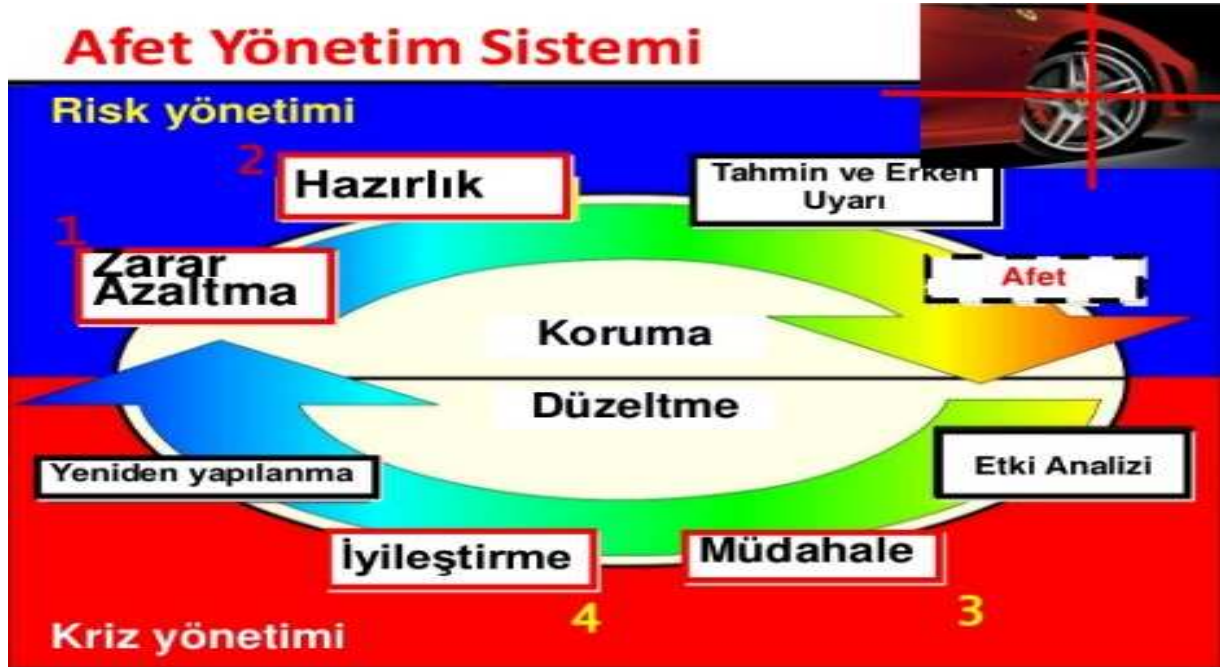
Şekil 2’de Türkiye’deki Afet yönetimi sistemi anlatılmıştır.