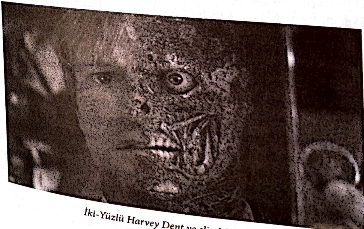
İki-Yüzlü Harvey Dent ve diğ...

Yazının başında filmin zengin içeriğinden bahsetmiş ve bunların tamamının ortaya konmasının imkânsızlığını ileri sürmüştük. Şimdi sadece değinileceğini söylediğimiz ve başlı başına ayrı yazı konusu olacak iki ayrı okumadan bahsedelim. Bunlardan ilki için filmin üç başkarakterinden esinlenilebilir. Üç ana karakterimiz; iyiliği ve düzeni temsil eden Batman , kötülüğü ve kaosu temsil eden Joker ve başına gelen korkunç olaydan sonra yüzü yanmış bir halde hem iyiyi hem de kötüyü aynı anda içinde barındıran ve saf şansı temsil eden İki-Yüzlü ( Two-Face ) Savcı Harvey Dent'tir. Bunların her biri, adalet konusunda farklı fikirlere sahiptir. Batman 'e göre adalet, düzen ve iyilikten doğar. Joker ise bunun tam tersi olarak kaosu adil olarak nitelendirmektedir. İki-Yüzlü'ye göre ise adil olan tek şey şanstır. Önyargısız ve tarafsız olan şans, aynı zamanda dünyadaki tek ahlaki şeydir. İşte bu üç farklı adalet tanımını bu karakterler üzerinden ortaya koymak yapılabilecek okumalardan birisidir.